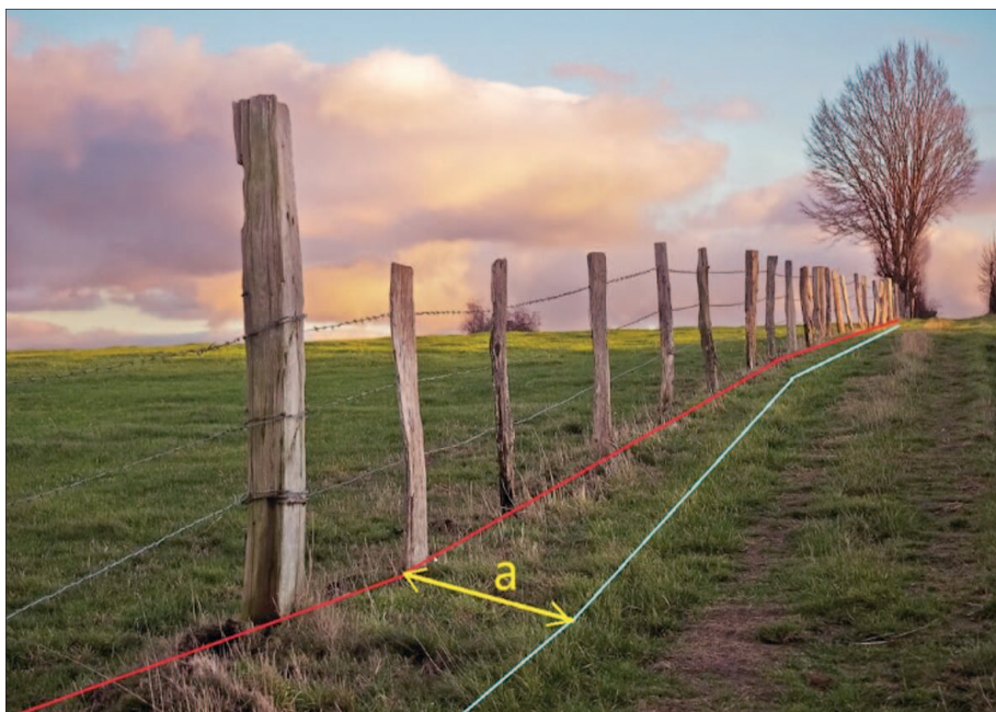
Obrázek znázorňující skutečný průběh hranice (zelená) a zaplacenou hranici pozemku (červená) a = rozdíl

Skutečná hranice vašeho pozemku se nemusí shodovat s plotem nebo zdí, které vidíte v terénu. Důvodem je historický vývoj katastrálních map v České republice. Na zhruba polovině území Česka jsou dosud používány tzv. grafické mapy v měřítku 1:2880, jejichž základ vznikl už v 19. století. Tehdejší metody měření, někdy dokonce i pouhé „krokování“, znamenají, že přesnost polohopisu se může lišit i o několik metrů. Při digitalizaci se mapa převádí jen do elektronické podoby, hranice pozemků však zůstávají nepřesné.