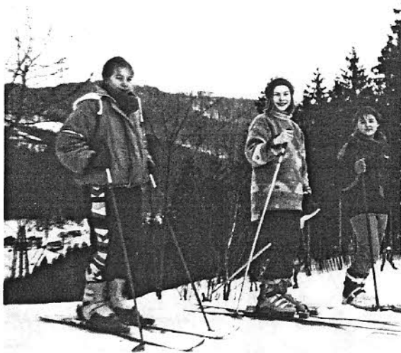
Snímek je z lyžařského výcviku v r. 1995

V únoru letošního roku byl pořádán lyžařský výcvik pro žáky 7.ročníku. Týdenního pobytu v Dolním Maxově v Jizerských horách se zúčastnilo 31 žáků. Za velmi příznivých podmínek se děti naučily a zdokonalily v lyžování.